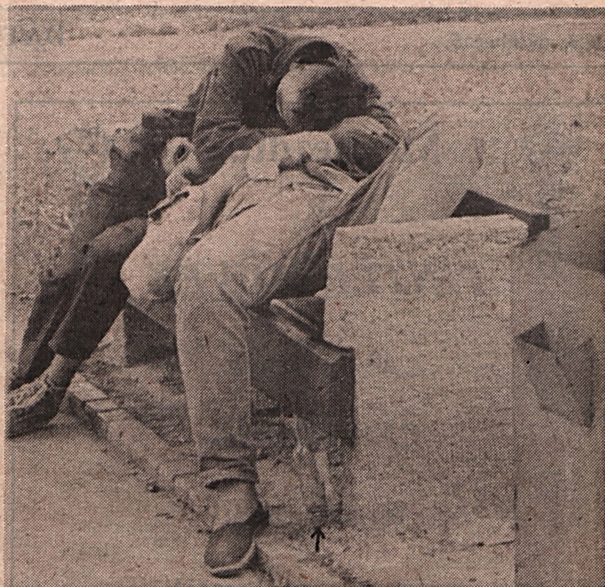
Bódulatban címmel bűnügyi kiállítás nyílt tegnap Nyíregyházán, a megyei művelődési központban