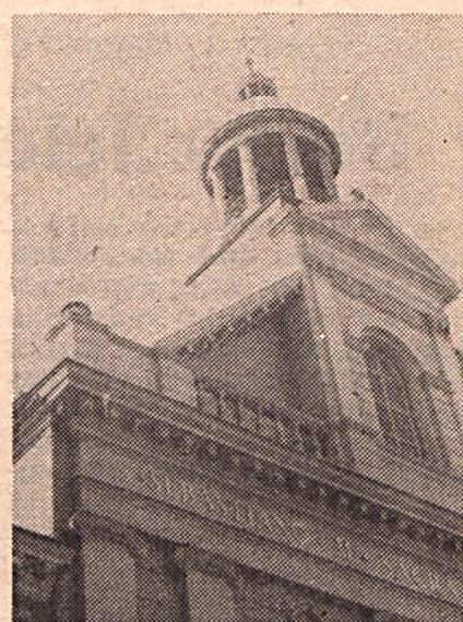
A pécsi Irgalmastemplom

tek. Orvosok, gyógyszerészek, ápolók voltak a szerzetesek és ma is azok szerte a világban, ahol még létezik ilyen rend. A szomszédos Ausztriában például 10 irgalmas kórház működik — kiválóan.