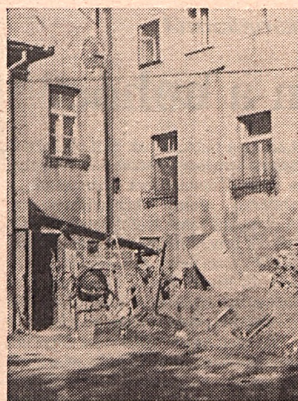
Így fest ma a kápolna

Az Irgalmasrend tagjai a tisztaság, a szegénység és az engedelmesség mellett, betegápolásra is fogadalmat tet-