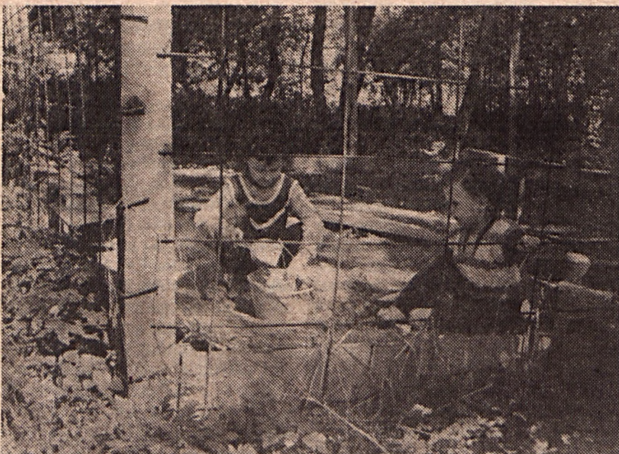
Az új testvérekre várva, kettesben