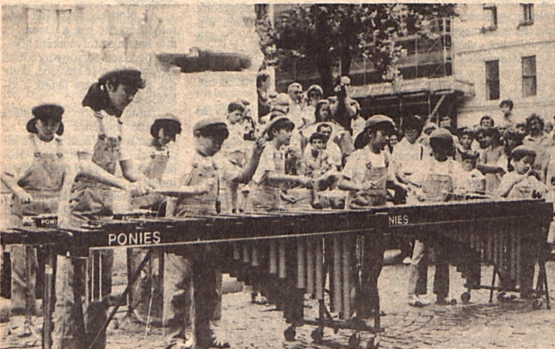
A Pónik a Vörösmarty téren zenélnek