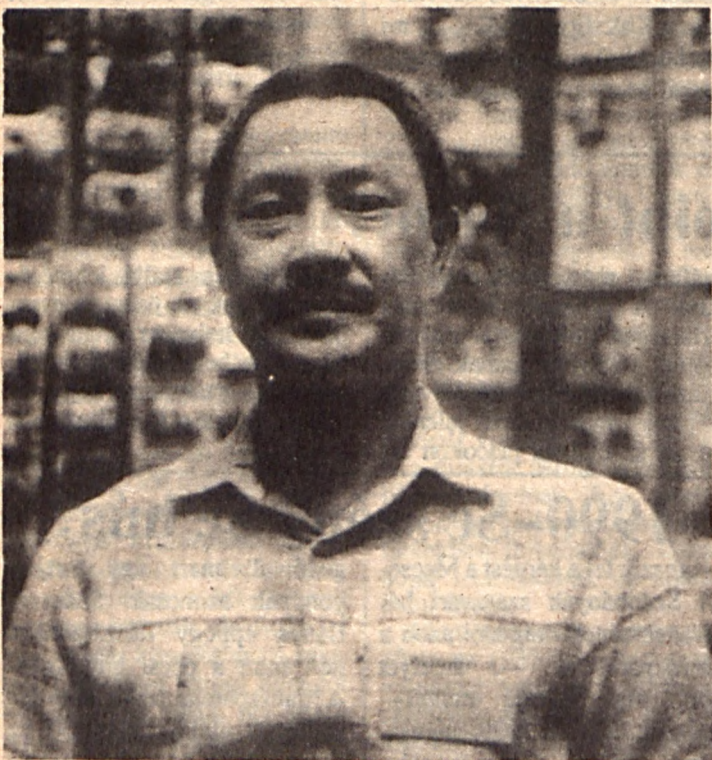
A hongkongi játékkereskedőház alkalmazottja bízik a sikerben