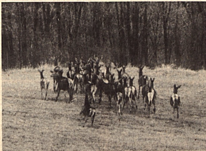
Ki elől futtok jövődó trófeák?

Arról is szívesen olvastunk volna őszinte sorokat a miniszteri levélből, hogy azzal a bizonyos nettó árbevétellel mi történt? Pontosabban a gazdaságok hova és mennyit adóztak? Mert azt már sikerült kideríteni, hogy a magas beosztásúak egy-egy (és nagyon sok, renge-