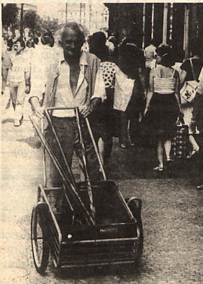
Vencel téri szemetes