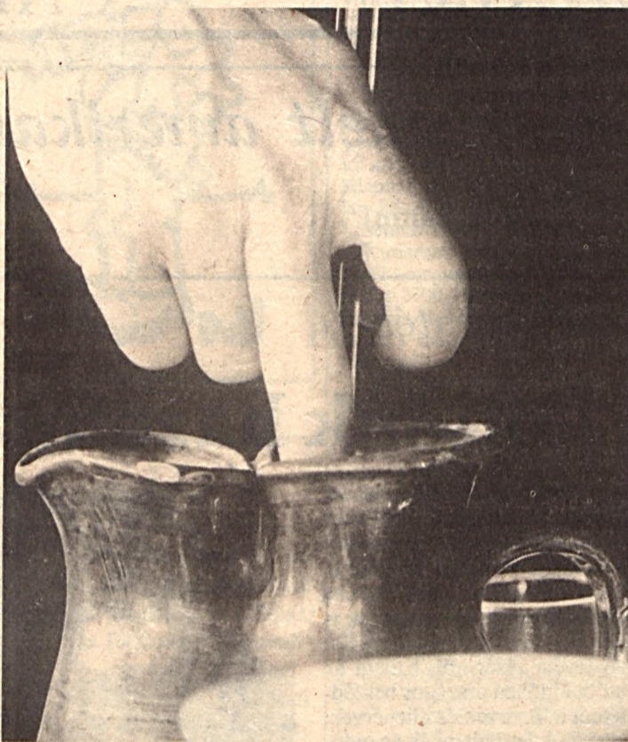
Ha már Szent Donát megvédte