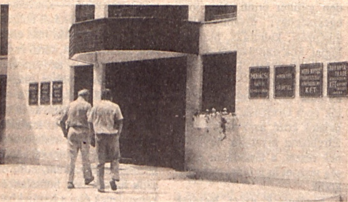
Közösségi, mozgalmi ház?

— Negyvenhatmillió forintba. Hangsúlyozom még