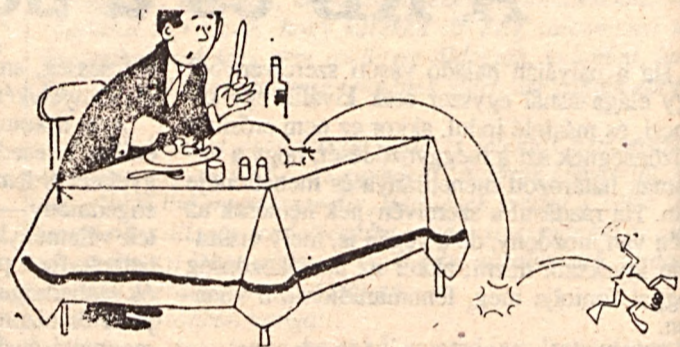
— Valóban friss a békacomb

sokat kezdett a belföldi ellátás javítására is. Így várható, hogy a tőkeshúskivitel — bár az időarányos mutatók jók — éves szinten nem haladja meg a tavalyi, mintegy 320 millió dollár értéket.