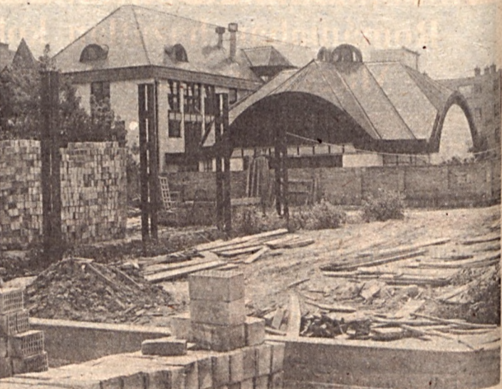
Mit lehet erre az épületre mondani?

Eddig a beszélgetés. Hogy ki mit szűr le belőle, az magánügy. Azonban az már közügy-