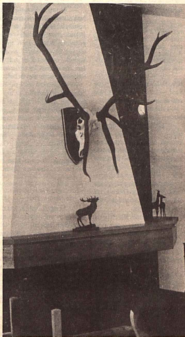
Csendélet egy vadászkastélyból