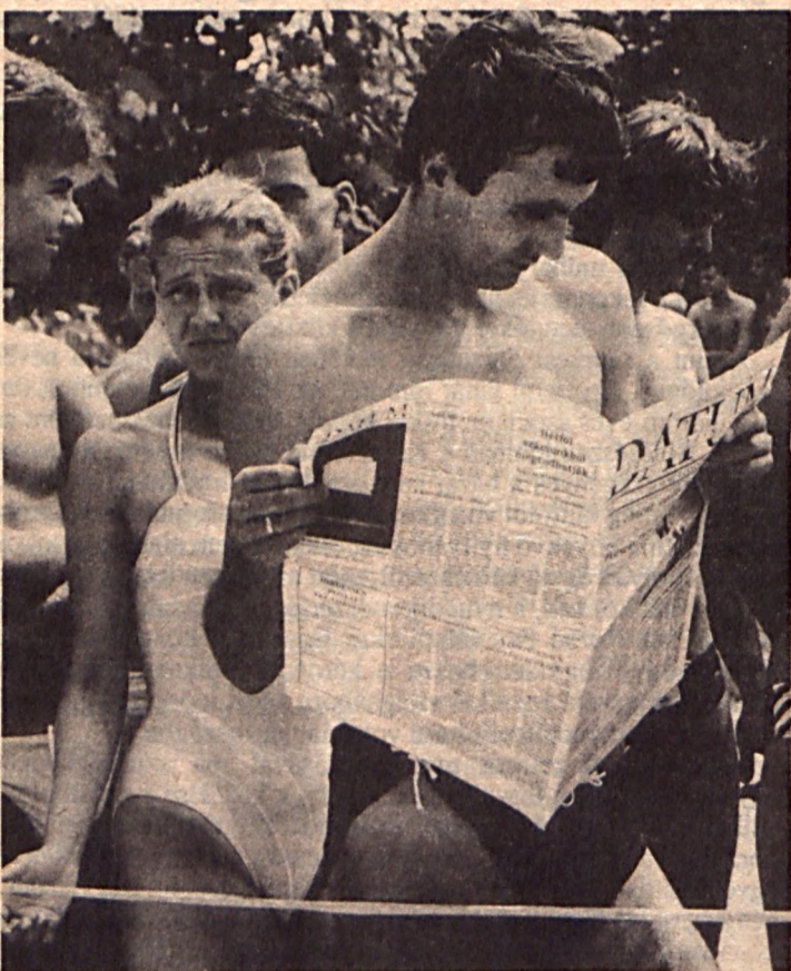
A résztvevőket motoros hajó szállította át Boglárról a túlpartra