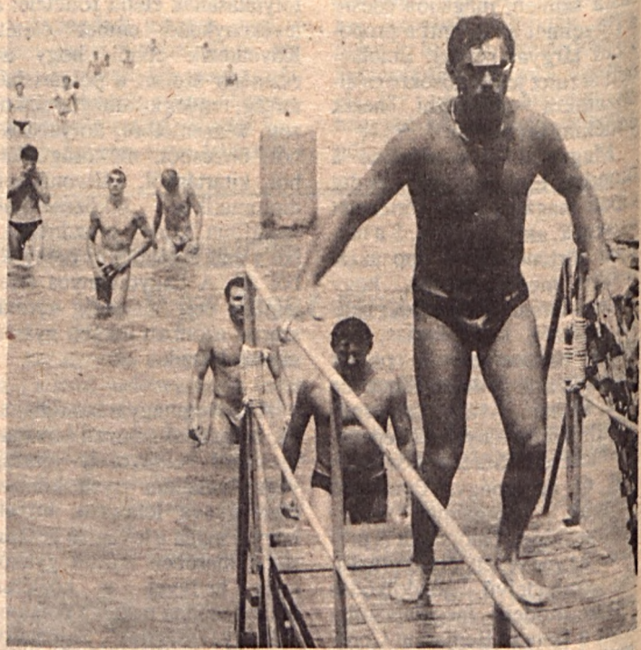
Az 5,2 kilométeres táv után sokan nem érezték biztos talajt a lábuk alatt