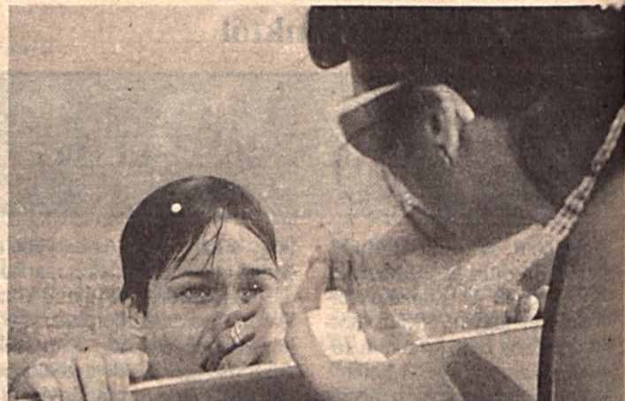
A Somogy megyei tanács elnökének felesége nemcsak a kisfiának, az ismerősöknek, hanem a „rászorulóknak” is osztogatta a szőlőcukrot a rendőrségi motorcsónakból