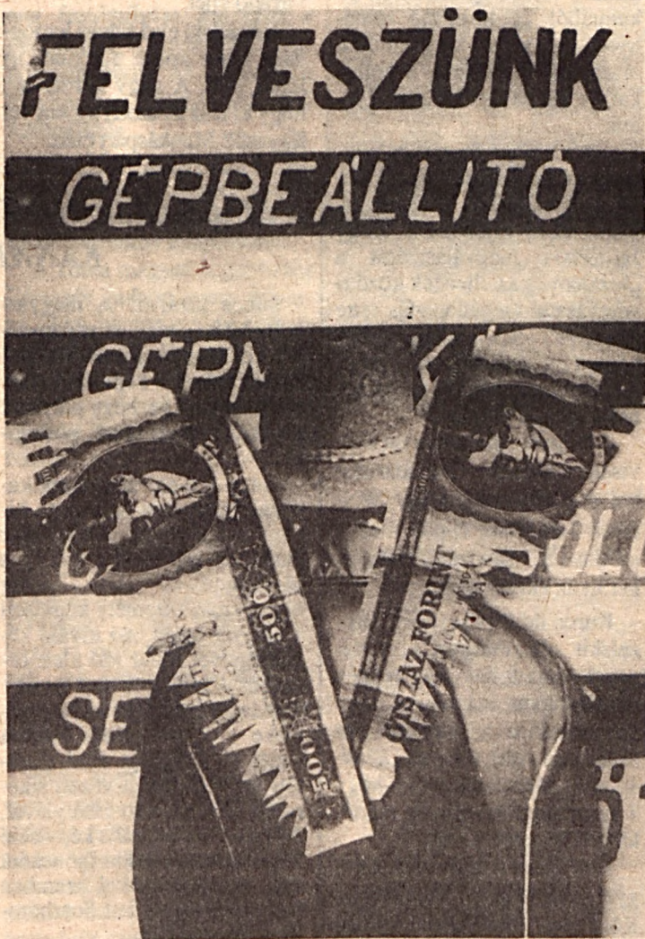
Eltűnnek a vándormadarak?