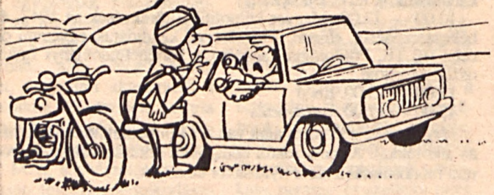
— Tessék, beszéljen az ügyvéddel!