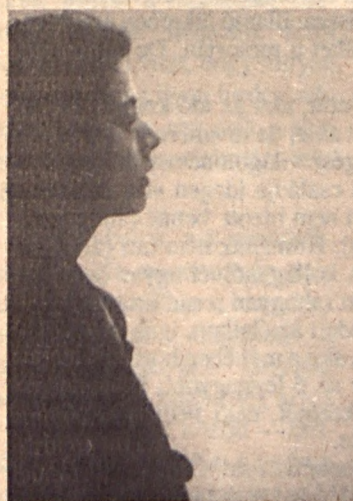
Mata Attila: Az artista