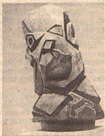
Mata Attila: A művészúr

hogyan van-e ma létjogosultsága a kisleplasztikának.