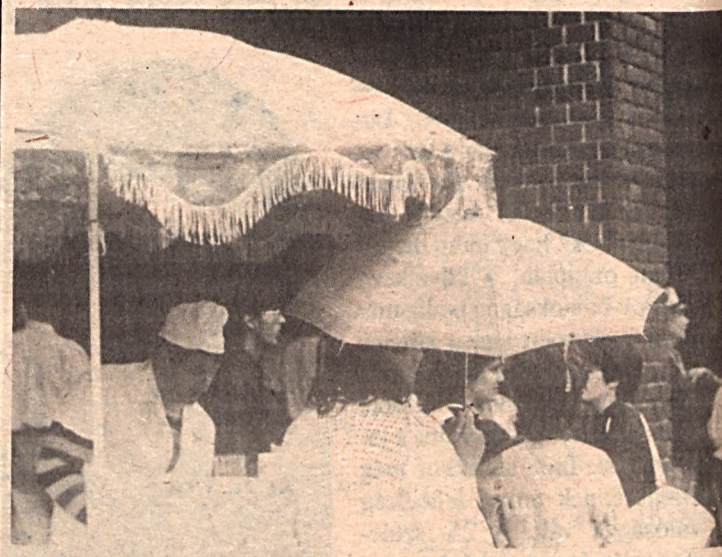
avagy változókon az időjárás s gyakran esik is.