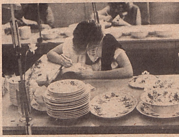
Az aranyozóban. A kínai porcelánokat idéző elefántcsont színű fajansz

A termelés nagy részét ma is a porcelánszigetelők és az edénygyártás teszi ki, a művészi áruk jóval kisebb számban kerülnek ki a gyárból. Érthetően, hiszen a legmunkaigényesebb, híven ragaszkodnak a hagyományos eljárásához. Ezért a nagy kereslet, huszonhat államba szállítanak luxusporcelánokat, a kontinensen kívül Japánba, Szaud-Arábiába, az USA-ba, Kanadába, a műszaki kerámiák Olaszországba, Indiába, Egyiptomba jutnak el egyebek mellett.