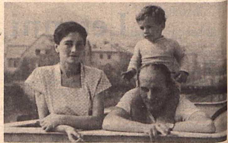
Feleségével és fiával 1947-ben

— Augusztusban ezredessé, egy évvel később vezérör-