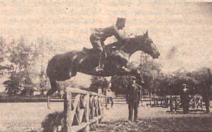
A Ludovika lovasversenyén