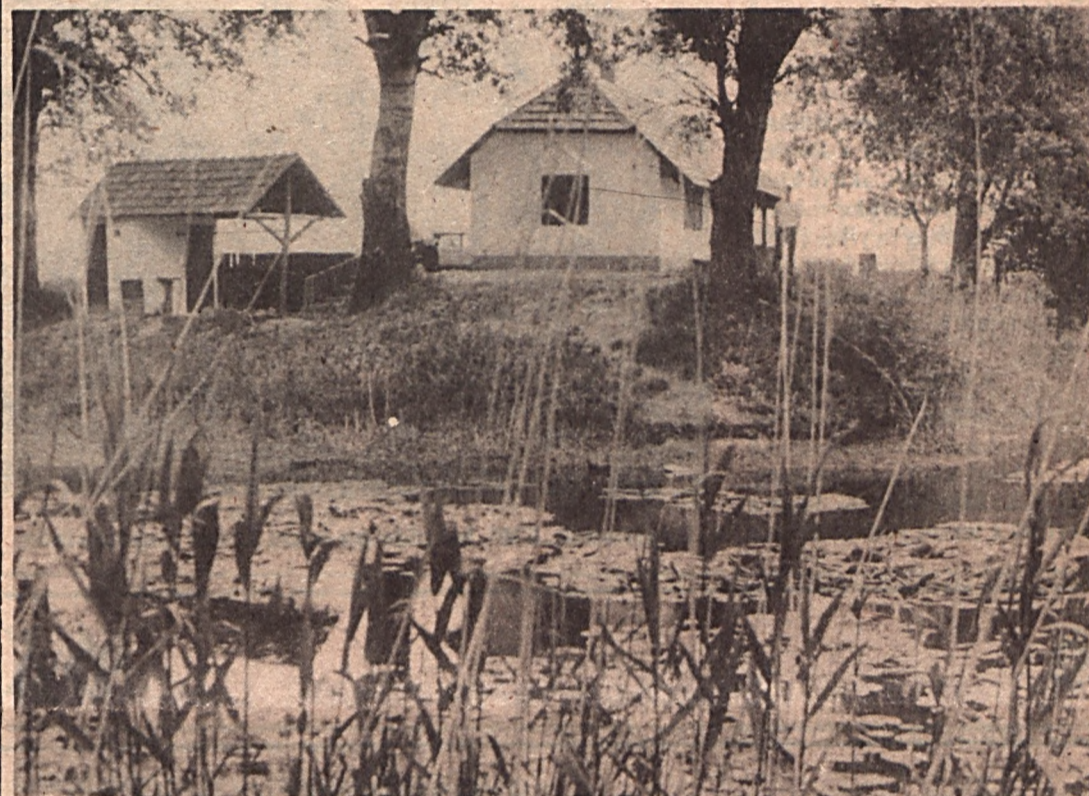
A szabadidőpark a Feketevíz partján

Talán negyedszázada, hogy mint népművelő jártam a mőzsi Új Élet Mezőgazdasági Termelőszövetkezetben. Nem titkolt szándékom volt, hogy segítsek pénzt szerezni ottani kollégámnak. Ebben az időben ugyanis már fokozatosan romlottak a népművelődésben az anyagi feltételek. Drágultak az előadások közvetítési díjai, tehát emelni kellett a jegyárakat, a közönség fogyott, nehezebbé vált a berendezések pótlása, csinosítása, az épületek kar-