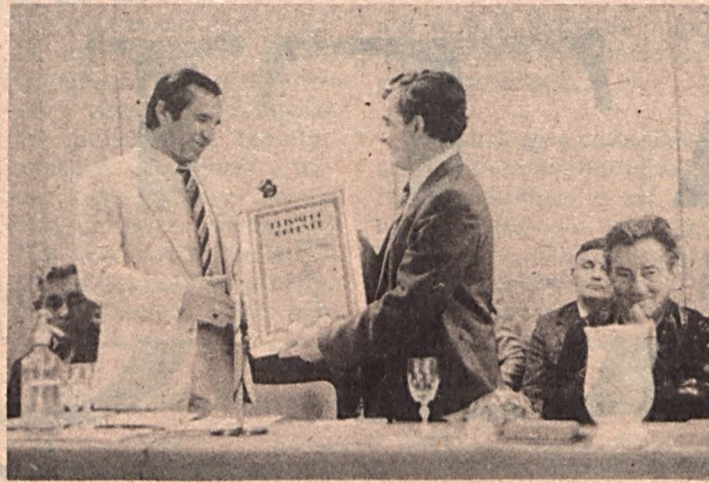
Szülinapi csecsebecse a szakminisztériumtól