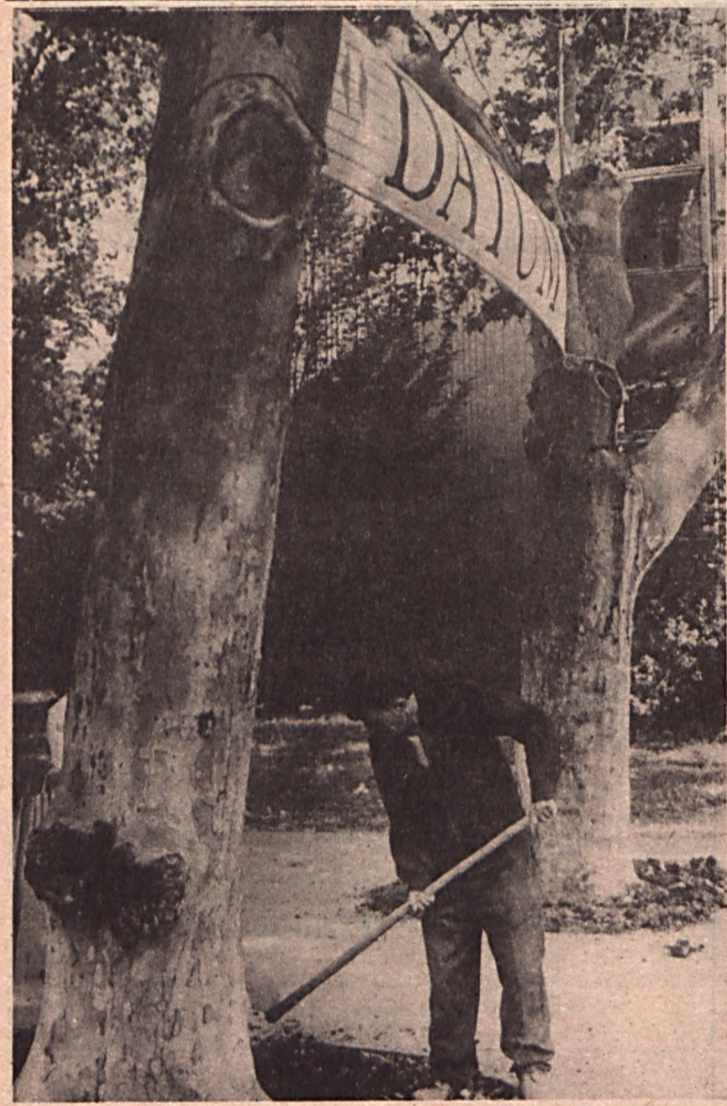
Szekszárdon, a Vasúti fasor szép platánjai tövébe, gazdag, televényes földet raktak tegnap a Városgazdálkodási Vállalat dolgozói. Köztük a DÁTUM fája is kapott, hogy a többivel együtt szépen terebélyesedjen, viruljon.