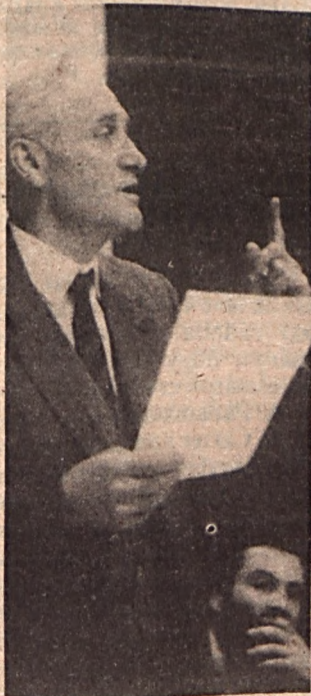
Szeretettel köszöntjük a hatvanéves Kányádi Sándort