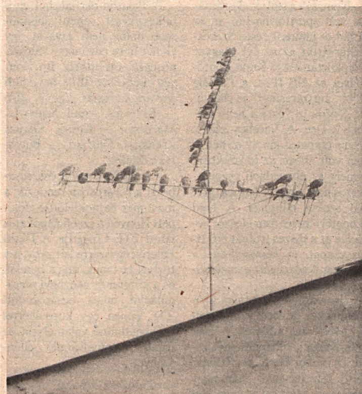
A galambpostának már vége. Mostanság galamblelkű postások hozzák leveleinket, pénzeinket, híreinket. No meg az éter hullámait. A nyugdíjas galambok, stilszerűen választottak maguknak pihenőhelyet.