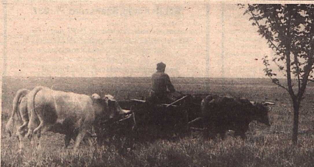
A XX. század végén Tolnában

tékben figyelembe kell venni valamennyi nemzet és nemzetiség érdekét. Ezt egyáltalán nem könnyű megtenni egy olyan hatalmas, soknemzetiségű országban, mint a Szovjetunió. Meg kell találnunk az összhangot az egyes népek vágyai és törekvései, valamint a szövetség erősítésének szükségessége között. Ezt a feladatot csak a 15 egyenjogú, szuverén köztársaság szövetségének demokratizálásával és az összes szövetségi funkció megújításával lehet elvégezni” – mondta a külügyminiszter.