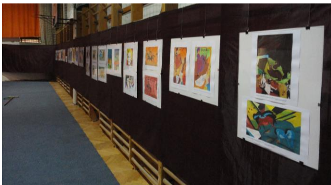
Bükkösi Kézműves Tanszak