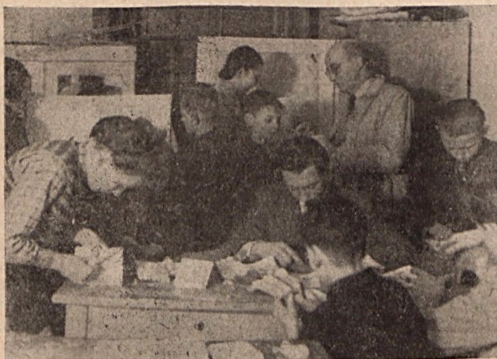
Munka közben a Szigetvári Úttörő Technikai állomás szobrász szakköre

Még december végén történt. Leesett az első hó. Az egyik őrszervező jött hozzám azzal a kéréssel, lehet-e szervezni sí-túrát? Összehívtam a csapattanácsot, hogy az őrszervező pajtás javaslatát megbeszéljük. Ott elmondtam az én véleményemet is. Én javasoltam, hogy sí-túrával egybekötött téli tábort szervezzünk. A vitát tettek követték, melynek eredménye az volt, hogy a szalántai úttörők 4 napos téli táborba vonultak, január 2—6-ig. A csapat zászlója 4 napig lengett sátor táborunkon, és a nagy hideg ellenére egy szülő sem hívta haza gyermekét, és nem is betegedett meg senki.