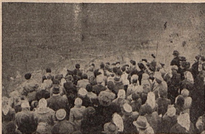
A Felszabadulási Tanulmányi Verseny résztvevőinek mecseki kirándulása

Legközelebbi ülésén a Baranya megyei iskolákban folyó testnevelés helyzetét tárgyalja meg a Tanács.