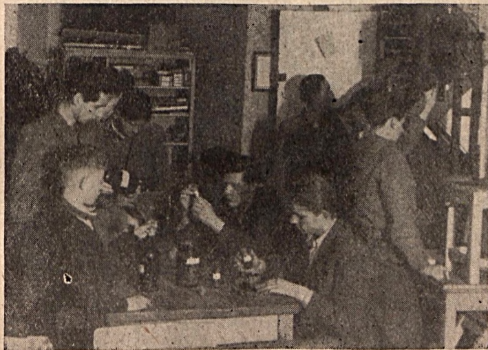
Szakköri foglalkozás a Szigetvári Úttörő Technikai állomáson

Én, mint a szalántai úttörőcsapat jelenlegi vezetője érzem ezt legjobban. Igen sok hiányossággal vettem át a csapatot, nem is tudtam, hol kezdjem a mozgalmi élet megszervezését. Ekkor jöttem rá, hogy egy csapat papíron is dolgozhat, mert itt falvakban, de talán városokban is előfordult ilyen.