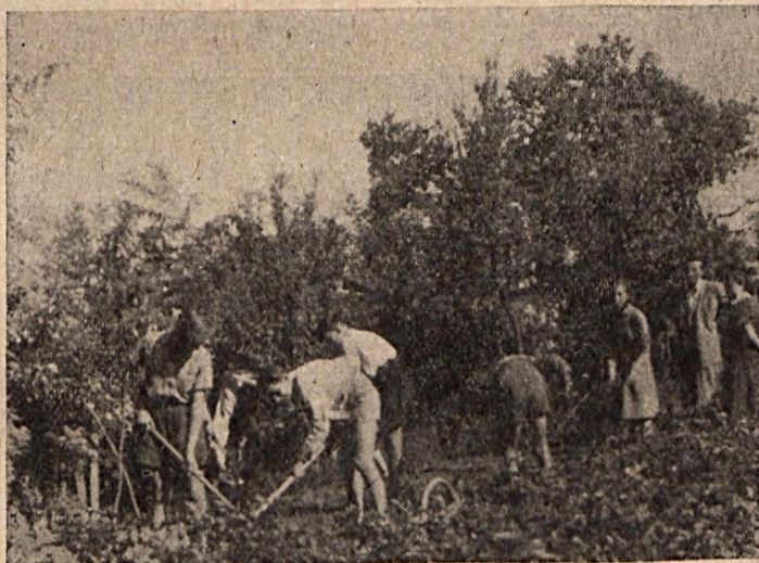
Gyakorlókertir munka Szigetvárott

Felhívjuk úttörő csapataink figyelmét, hogy a Dunántúli Napló minden hónap egyik vasárnapján külön oldalon „Úttörő rovat”-tal jelentkezik. Foglalkozik a rovatban a Baranya megyei úttörő csapatok életével és az úttörők számára sok hasznos ismeretet közöl. Kívánatos, hogy úttörő csapataink a Dunántúli Napló ezen számainak megrendelését és a rovat rendszeres olvasását biztosítsák.