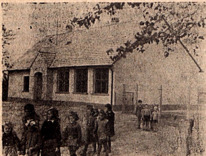
A kovácshidai egy tantermes tanítói lakásos típus-iskola