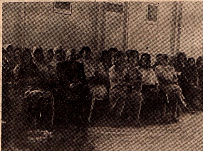
Délszláv szülők látogatása a délszláv diákotthonban

A Megyei Oktatási Osztály háromnapos tanfolyamot szervezett az ideológiai továbbképzés propagandistái részére. A tanfolyamon néhány elméleti kérdést, valamint a propagandista munka módszertani kérdéseit beszéltek meg.