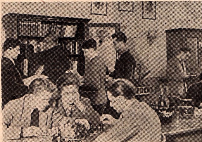
Szabad foglalkozás a Nagy Lajos gimn. diákközhelyén

A Nevelők Napján az egész megyében egységesen a Központi Vezetőségnek „Az ifjúság között végzett munka megjavításáról“ szóló határozata végrehajtása érdekében az ifjúsági szervezetek munkájával való foglalkozás feladatait beszélték meg nevelőink. A kultúrmasort pedig Bartók Béla halála 10 éves évfordulója megünneplésének jegyében állították össze.