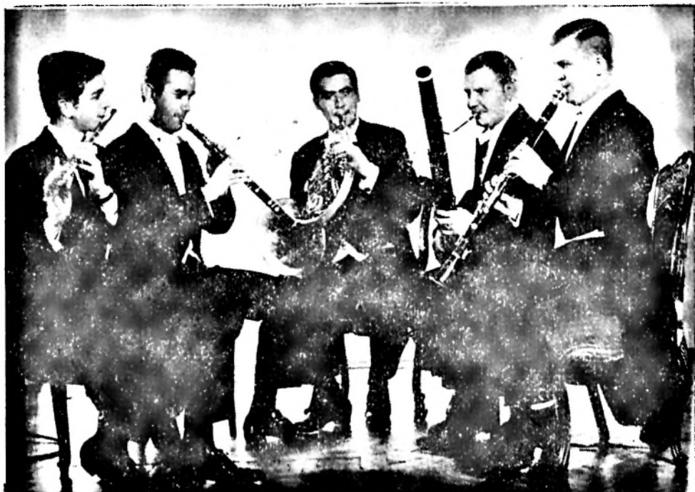
A Mecsek Fúvósötös