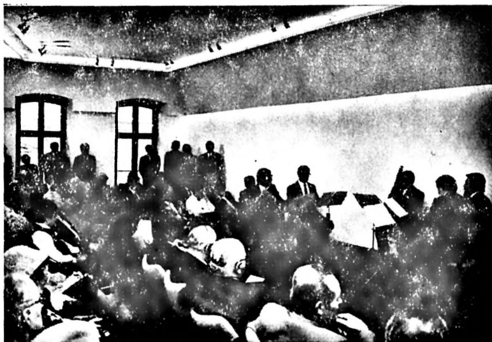
A Mecsek Fúvósötös a Művészetek Háza megnyitásán

A közel 20 egyetemi tanár által tartott előadás közös vitáján bizonyították a résztvevők a tudás demokratikus megosztásának és megszerzésének lehetőségeit, a műveltség paternalisztikus adományjellegével szemben hangsúlyossá tették a helyi társadalmak ismeretszükséglete által meghatározott, jelen és jövő hangsúlyos, rugalmas, haszonelvű és a csoportérdekek politikációját is felvállaló szabad tanítás jogát, a közművelődés öngazgatását, a műveltség demokratizálásával a társadalom politikai demokratizmusának alapozását. A liberális progresszív értelmiség és a szociáldemokrata munkások szövetségének egyik legszebb, legnagyobb hatású fóruma volt az 1907-es Pécsi Szabad Tanítási Kongresszus. (Az idézetek A Szabad Tanítás Országos Kongresszusa jegyzőkönyvéből valók.)