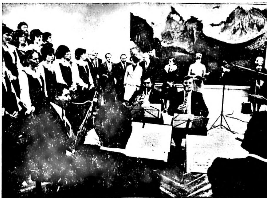
A Mecsek Fűvösötös a Csontváry Múzeum megnyitásán