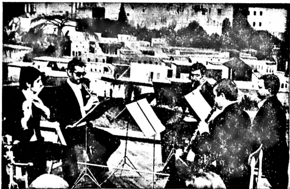
A Mecsek Fúvósötös a Csontváry Matinén játszik