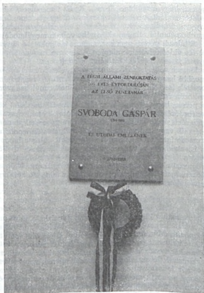
A pécsi állami zeneoktatás 200 éves évfordulóján elhelyezett Svoboda Gáspár emléktábla

Ez a tábla pedig segítse mindig az erőt, bátorságot adó termékeny emlékezést.