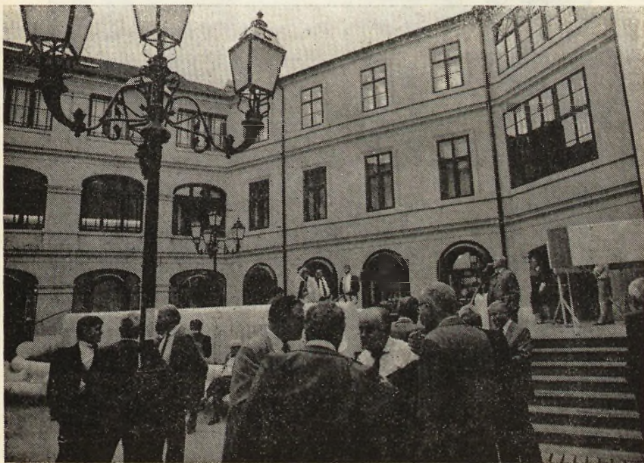
A Széchenyi tér 8. sz. épület az udvar felől