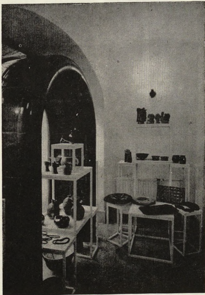
Karácsonyi vásár a Minigalériában