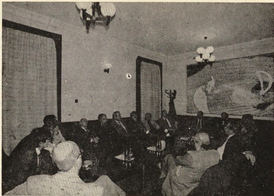
A művészeti szövetség vezetői találkozójuk az Elze Gyógygyei klubban