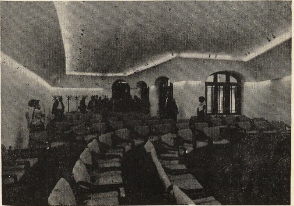
A nagy előadóterem