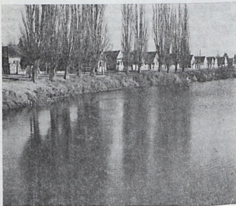
Holt Drávaág Szaporcánál

Természetesen nem a címek elnyerése vagy a teljesítmény misztifikálása a cél, hanem arról van szó, hogy olyan munkaalkalmat kell intézményesíttetten biztosítani, amely immanens lényegénél fogva egy életre megragadja, elkötelezi a humanizmus csíráját magában hordó embert. Ilyen, a legjobban rászoruló gyermekekkel való foglalkozás, amelynek nyomán az emberi melegség sugarainak visszfénye, a szerencsétlen emberpalánták arcának szomorkás derüje vagy hátatelt felragyogása biztosítja az igazi átélést, a hivatással való teljes azonosulást.