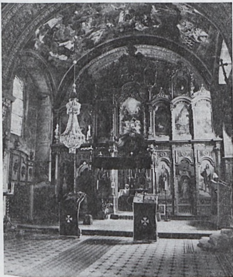
Mobács, görögkeleti templom

Epilog (Befejezés) zárja le a hosszú verset, melyben mintegy összegezi a sokféle árucikket, mesterséget, mit megénekelt. Így fejeződik be az ígéretesen és lendületesen induló, majd végül teljesen üzleti leírásokba torkolló séta, melynek legvégén a szerző nevét is ott találjuk: R. Lövvő. Személyéről – egyelőre – nem sikerült közelebbit megtudni. Nagy a valószínűsége, hogy az ekkoriban népszerű pécsi német nyelvű hetilap, a Fünfkirchner Zeitung tollforgatói köréhez tartozott.