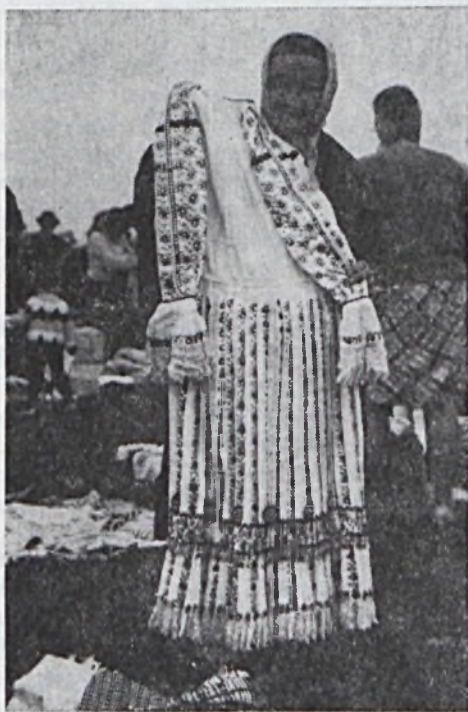
A pécsi vásáron

Pécs szellemi-irodalmi életének ez a harmadik reneszánsza napjainkban is tart, sőt tovább gazdagodik, nő és gyarapszik . . .