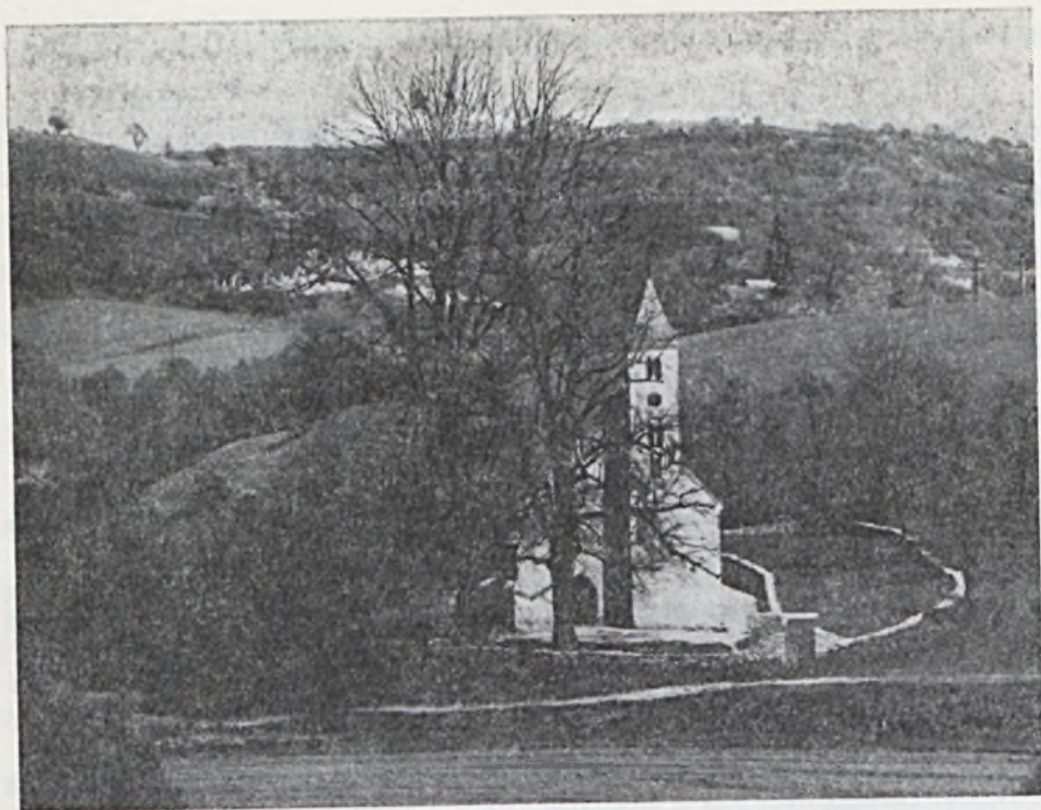
Mánfa, Árpád-kori templom