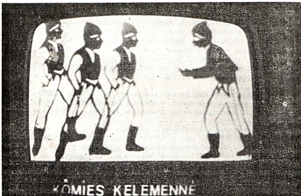
Százszorszép együttes előadása a képernyőn