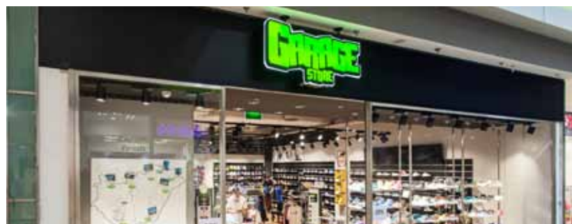
Már nálunk is van Garage Store. Az üzlet földszintünkön vár mindenkit, akinek az öltözködés egyben életstílus is.