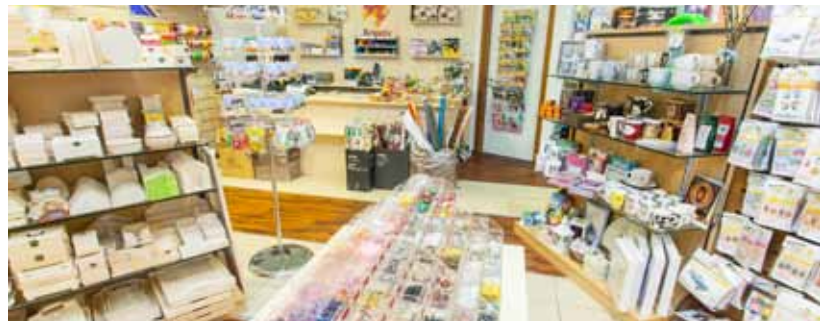
Kreatív Hobby üzletünk megújult. A felső szintünkön található üzlet minden fantáziadús és kis kezűgyességgel rendelkező látogató kedvence.