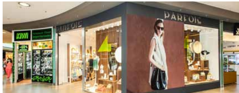
Legutóbbi lapszámunk óta megnyitott Parfois üzletünk, mely felső szintünkön várja a kiegészítőre is igényes hölgyeket.