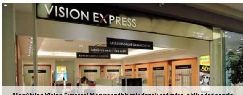
Megújult a Vision Express! Még vonzóbb mindazok számára, akik nézőpontja szerint a szemüveg nemcsak a tökéletes látás eszköze, hanem egy divatos kiegészítő is, amely stílust ad, öltöztet.