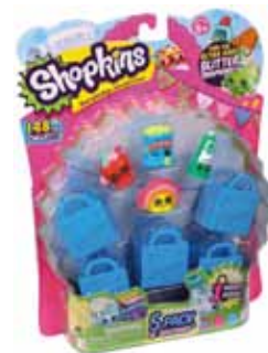
2 Játéksziget – Shopkins játékszett