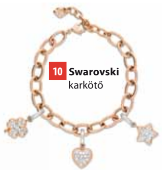
10 Swarovski karkötő