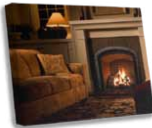
5 Fotoplus – Vászonkép