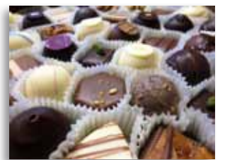
7 Csoki Korzó – kézműves csokoládék