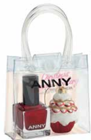
8 Douglas – ANNY karácsonyi csomag