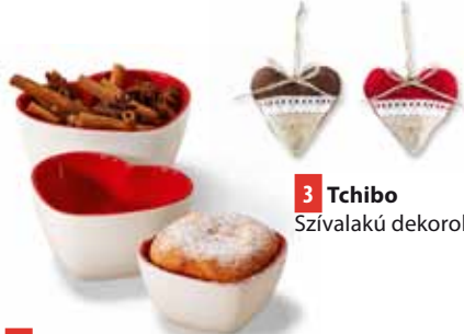
3 Tchibo Szívalakú dekorok