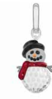
12 Swarovski hóemberalakú medál