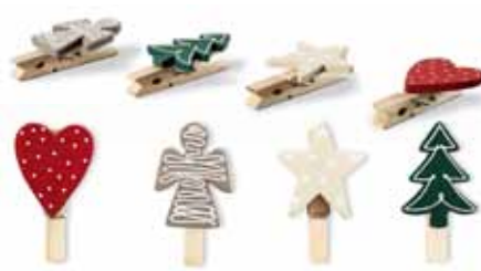
1 Tchibo – Dekor csipeszek

közt girlandok, dísz tárgyak, világító ablakdíszek, asztaldíszek, dekorációs kiegészítők és adventi koszorúk is megtalálhatók. Koszorúkészítés előtt mindenképp érdemes betérni a Fleur-t üzletbe is, ahol lakásának színvilágához illeszkedő díszekből, szalagokból válogathat, s kész asztali dísz, adventi koszorút is rendelhet profi virágkötőktől. Tchibo üzletünk karácsonyfadíszei, díszcsipeszei, szíves tálcái, adventi gyertyatartó tálcái 1-4 szintén ékes elemei lehetnek lakásunknak. Az ünnepi gyertyák, a karácsonyt idéző illatok (fahéj, alma, mézeskalács) nélkülözhetetlen elemei az otthonunknak ebben az időszakban. Míg anyuka készíti a mézeskalácsot, a gyerekek elkészíthetik kedvenc sütiüket a Játéksziget által ajánlott gyurmából. A Plastelino Falatozó gyurmakészlet 6 segítségével különleges, szemet gyönyörködtető finomságokat tudnak a kicsik megformálni gyurmából. A gyurmakészletben eszközöket és sablonokat találhatnak, valamint vanília illatú gyurmákat. Ínycsiklandó süteményeket