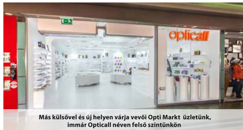
Más külsővel és új helyen várja vevőit Opti Markt üzletünk, immár Opticall néven felső szintünkön