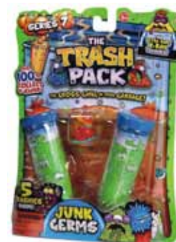
4 Játéksziget Trash Pack játékszett