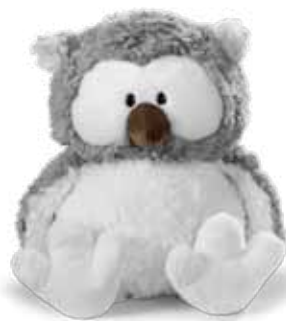
15 Happy Box Plüss hóbagoly