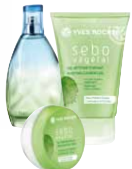
14 Yves Rocher – szépségápoló szerek