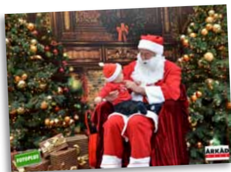
1 Fotoplus – Fényképes ajándékok

Interspar, Swarovski 10-12, Yves Rocher 13 és a Happy Box 14 ünnepi ajánlataiból szintén könnyedén kiválaszthatják kedvenceiket.