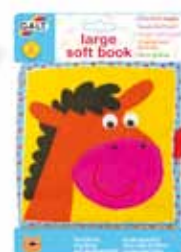
5 Játéksziget GALT textilkönyv