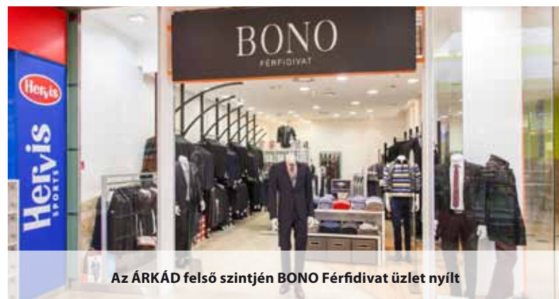
Az ÁRKÁD felső szintjén BONO Férfitáru üzlet nyílt