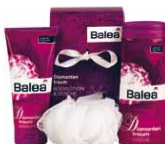
9 dm – Balea Diamanten csomag