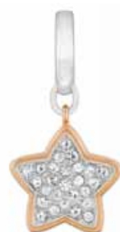
11 Swarovski csillagalakú medál