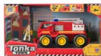
6 Játéksziget – Tonka járművek