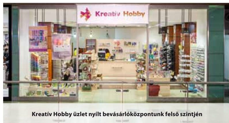
Kreatív Hobby üzlet nyílt bevásárlóközpontunk felső szintjén