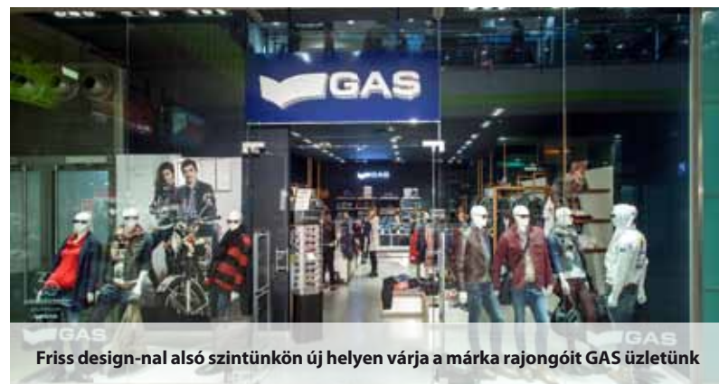
Friss design-nal alsó szintünkön új helyen várja a márka rajongóit GAS üzletünk