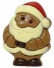
6 Csoki Korzó csokoládé nyalóka