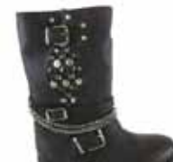
Replay Terry black 60.990 helyett 30.490,-