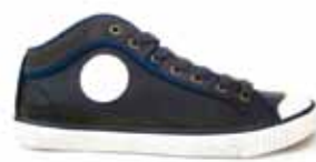
Pepe Jeans 30789 575 blue 21.990 helyett 10.900,-

BORGÓ – Milyen is lenne egy túra kényelmes cipő nélkül! Adjuk meg a lábunknak is, amire szüksége van! Divat, minőség, akciók: BORGÓ cipőbolt. A hely, ahol beszerezhetik a legtrendibb cipőket! Az üzletben számos világmárkát megtalálnak, mi több, ellenállhatatlan ajánlattal várják Önöket. A BORGÓ 50% kedvezményt nyújt az őszi-téli kollekcióra, amíg a készlet tart. Érdemes hát szedni a lábunk egy-egy jó fogásért.