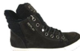
Replay Hercules dk.grey 35.990 helyett 17.990,-