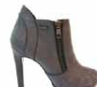
Gas- Tess grey 36.990 helyett 18.490,-