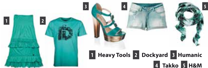
1 Heavy Tools 2 Dockyard 3 Humanic 4 Takko 5 H&M

Az ideai szezon színei közül kétségtelenül ő az egyik befutó. Túlzások nélkül viselhető, nem igényel plusz hivalkodó kiegészítőket, mert önmagában feltűnő, mutatós. Vörös hajúak sikert sikerre halmozhatnak emerald zöldben!