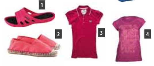
1 Budmil 2 H&M 3 Heavy Tools 4 Dockyard

kiegészítőben azonban bátran hordják a húszas éveiket nem épp tegnap betöltők is. Kiemeli, izgalmassá teszi az outfitet.