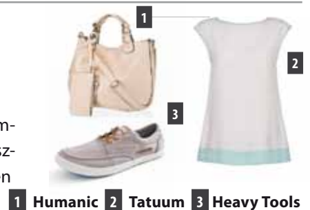
1 Humanic 2 Tatuum 3 Heavy Tools

Szaténos, enyhe metálfénnel kombinált összeállítások is gyakorta pasztellben mutatnak leginkább, legyen szó ruháról, vagy épp lábbeliről.