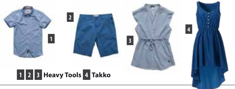
1 2 3 Heavy Tools 4 Takko

Szókéknek, barnáknak is jól áll: nyugalmat áraszt, mely a tenger és az ég simogatására emlékeztet. Lágyan omló anyagokra törekedjünk, ha kéket választunk, a bársonyos, selymes hatás ugyanis csökkenti a szín hidegségét.