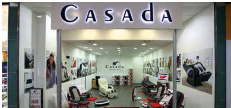
Casada üzletünk immár új helyen, felső szintünkön várja látogatóit!