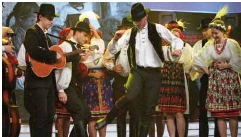
Az ÁRKÁD szurkol és szavaz! Tegyük meg ezt Önök is!

Alapdíjas sms üzeneteikkel a műsor ideje alatt támogathatják Pécs sokszínű kultúrájának képviselőjét, a Tanac Néptáncegyüttest.