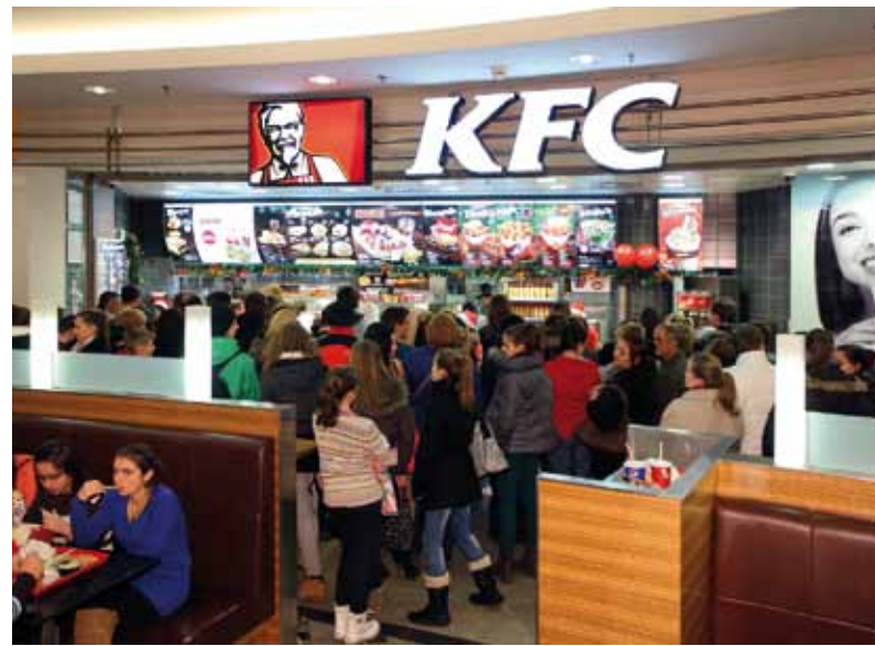
KFC – December 6-tól friss KFC-vel várjuk Önt az ÁRKÁD-ban!