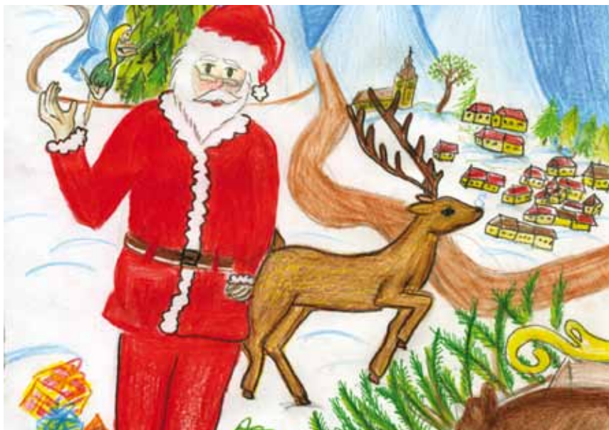
Előző Gyermekszemmel pályázatunk témája: „Mikulás”. A nyertes: Fodor Noémi (7. osztályos). Nyereménye egy 5 000 Ft értékű ÁRKÁD vásárlási utalvány.