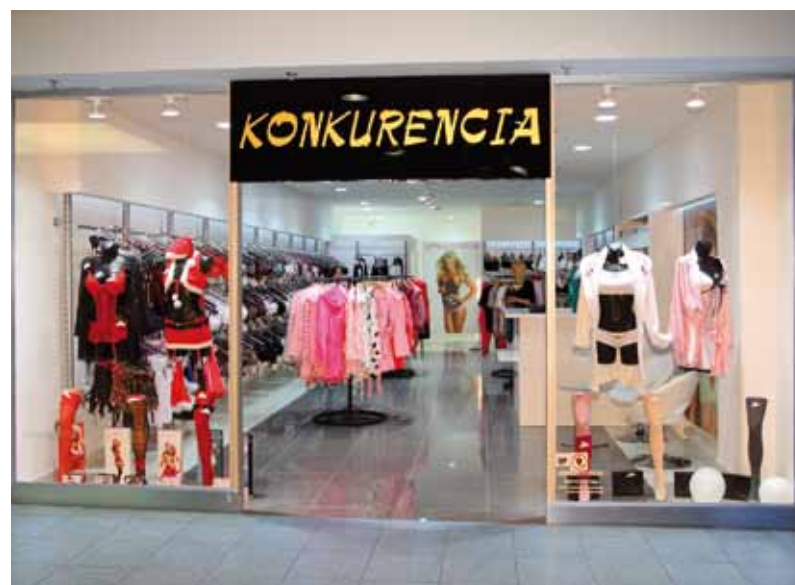
KONKURENCIA – "Konkurencia fehérnemű... a legközelebb hozzád..."

A Konkurencia az ÁRKÁD emeletén megnyitotta üzletét! A fehérnemű shop a Rákóczi út felőli bejárat közelében található. Aki még nem ismeri termékeiket, a www.konkurencia.hu internetes címen is tájékozódhat. Ha ellátogat a Konkurencia fehérnemű üzletbe, Ön is tapasztalhatja, hogy az új és kínálatában igen gazdag shop-ban nem kihívás megtalálni az Ön számára legmegfelelőbb fehérneműt. A nehézséget inkább a választás fogja okozni! Győződjön meg róla személyesen!