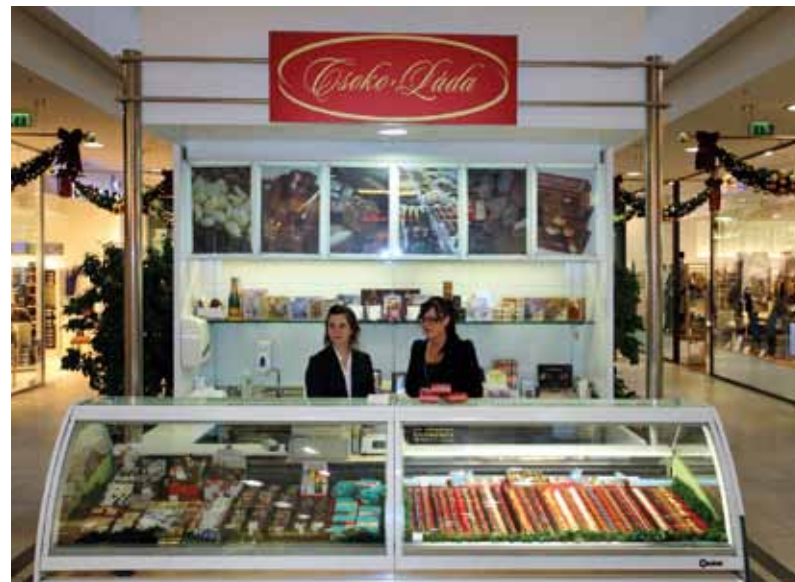
CSOKO-LÁDA – A minőségi CsokoLádék elkötelezett híve!

A Konkurencia az ÁRKÁD emeletén megnyitotta üzletét! A fehérnemű shop a Rákóczi út felőli bejárat közelében található. Aki még nem ismeri termékeiket, a www.konkurencia.hu internetes címen is tájékozódhat. Ha ellátogat a Konkurencia fehérnemű üzletbe, Ön is tapasztalhatja, hogy az új és kínálatában igen gazdag shop-ban nem kihívás megtalálni az Ön számára legmegfelelőbb fehérneműt. A nehézséget inkább a választás fogja okozni! Győződjön meg róla személyesen!