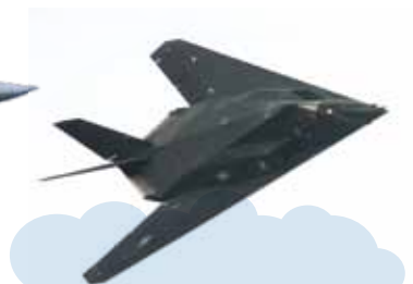
F-117 Lopakodó, ami a legkorszerűbb technikai vívmányok felhasználásával épült