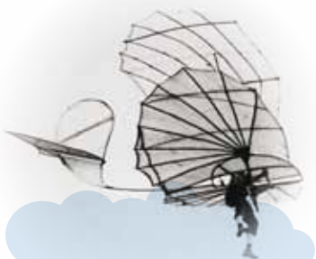
Otto Lilienthal merevszárnyú siklógépe, motor nélkül

A bevásárlóutcákon felépített interaktív szigetek mellett a repülés történetét az ÁRKÁD mennyezetéről lelógatott modellekkel is szemléltetjük. A repülőgépek fejlődését ugyanis a levegőben lebegő 5 db repülőgép makettal szeretnénk Önöknek még látványosabbá tenni.