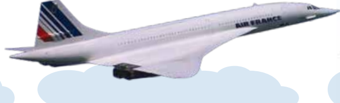
Concorde, ami az eddig épített legkülönlegesebb utasszállító gép