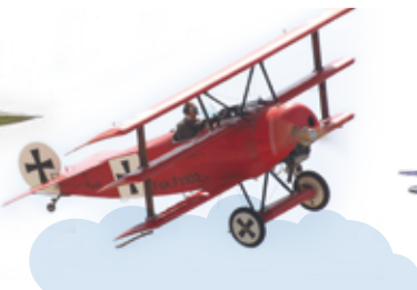
Fokker Dreidecker, a vörös báró híres háromfedelű vadászipülő gépének makettje