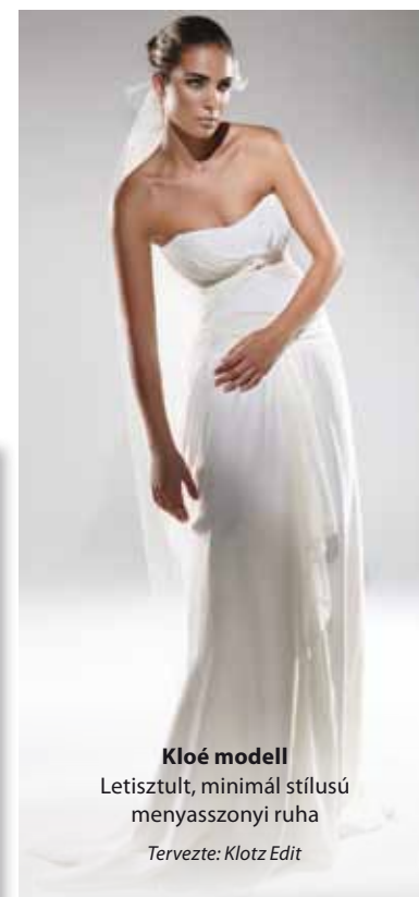
Kloé modell Letisztult, minimál stílusú menyasszonyi ruha Tervezte: Klotz Edit

Klotz Edit: „Magyarország nem tartozik a divat-és trenddiktáló országok közé: mi inkább követjük a fashion vonulatokat. Figyelemmel kell kísérni a nemzetközi divatforumokat, fashion week-eket, wedding expo-kat. Természetesen nekem is van kedvencem: ez Olaszország, ahonnan a ruhákhoz felhasznált alapanyagok nagy részét is beszerezem. A szezonról szezonra megújuló kollektívákban mindig jelen van az örök klasszikus elegancia, melyet a legfrissebb trend jegyeivel kell ötvözni. A 2012-es pret-a-porter kollektívára az élénk színhasználat, a paszpólok, csíkos sujtások és a kissé meghökkenítő színparosítások jellemzők. A trendi csontfehér színű menyasszonyi ruhákat illetően a formák letisztultak, a díszítések minimálisak. A menyasszonyi ruhát a hölgyek egyszeri és megismételhetetlennek szeretnék látni. Egyedit kell alkotni, mint ahogy minden hölgy is egy egyéniség.”