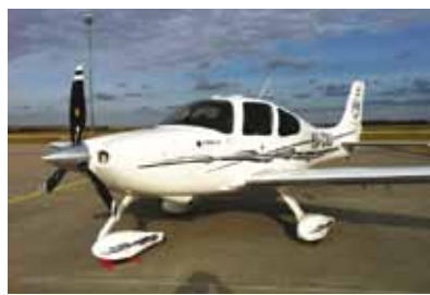
Május 31.-június 17-ig az ÁRKÁD-ban

emlékezetessé tegyünk Önöknek ezt a nem mindennapi tárlatot. Nyere-ményjátékkal is készülünk, melynek téje nem kevesebb, mint egy sétatrepülés lesz! Repüljön velünk Ön is az izgalmak és az élmények világába!