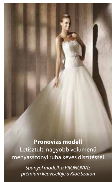
Pronovias modell Letisztult, nagyobb volumenű menyasszonyi ruha kevés díszítéssel Spanyol modell, a PRONOVIAS prémium képviselője a Kloé Szalon