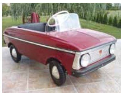
Május 14-20-ig az ÁRKÁD-ban

autót, melyet hajthatnak is, felidézve ezzel apu és nagypapa gyerekkori élményeit. Igazi retro érzés, valódi retro élmény az egész családnak az ÁRKÁD-ban.