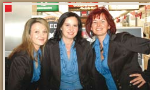
INFORMÁCIÓS SZOLGÁLAT (balról jobbra)