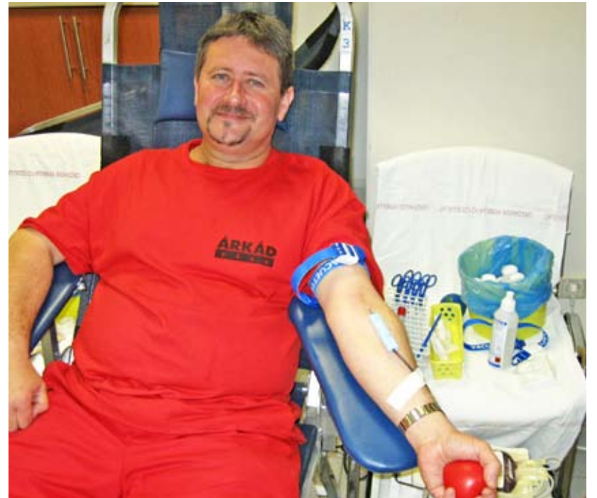
Az immáron havi rendszerességgel megrendezendő véradásokon a bevásárlóközpont igazgatóságának dolgozói is részt vesznek

Az ÁRKÁD-ban ez évben minden hónapban tartunk Véraladó napot. A Magyar Vöröskeresztrel való együttműködés sikerét Önöknek köszönhetjük, kedves látogatóink! Azoknak, akik most szeretnének először a rászorulóknak segítségére lenni, ösztöngyűjtöttünk néhány fontos, a véradással kapcsolatos információt. Az ÁRKÁD véradó standján a Magyar Vöröskereszt munkatársai és önkéntesei fogadják Önöket. Ismertetik a feltételeket, elmondják, hogyan lehet valakiből donor, s elkísérik a segíteni vágyókat az ÁRKÁD által kialakított véradóhelyiségbe. Bérőpartnerünk jövőképétől a véradóknak rendszeresen kedveskedünk egy kis apró ajándékkal is. Rendszeres támogatónk a Burger King és a Pizza Pont, a Korona Óra valamint az INTERSPAR, nekik külön köszönetünket szeretnénk kifejezni. A biztonságos hazai vérellátás érdekében ugyanis újabb és újabb véradókra van szükség. Éves szinten minimum 500 000 egység vért, azaz évente közel fél millió ember „adományát” kell a Magyar Vöröskeresztnek begyűjtenie. S hogy kiből lehet véradó? Bárkiből, aki egészséges, betöltötte 18. életévét, ám még nincs 65 éves. A véradó testsúlya meg kell haladja az 50 kg-ot! Hölgyek évente három, urak évente öt alkalommal adhatnak vért. Két véradás között minimum 56 nap kell elteljen!