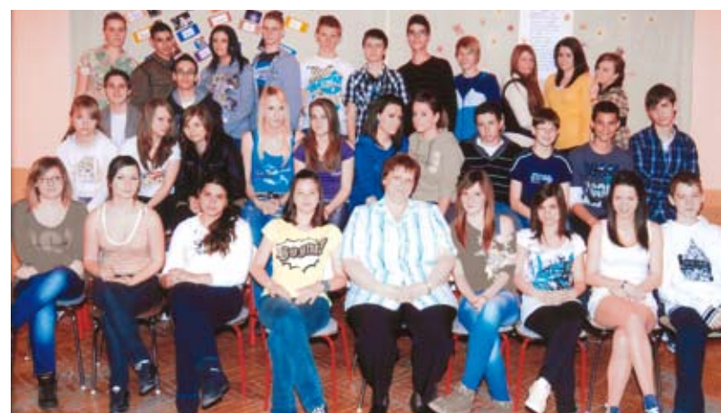
Radnóti Miklós Közgazdasági Szakközépiskola 0/9.B osztály