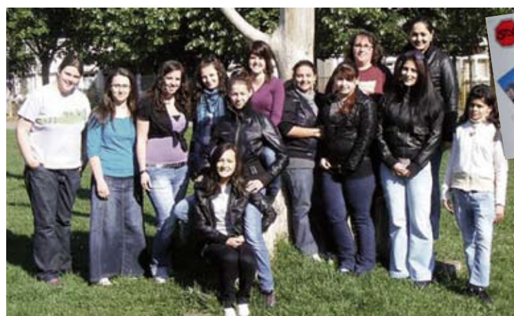
Pécsi József Nádor Gimnázium és Szakiskola Virágkötő-berendező osztály