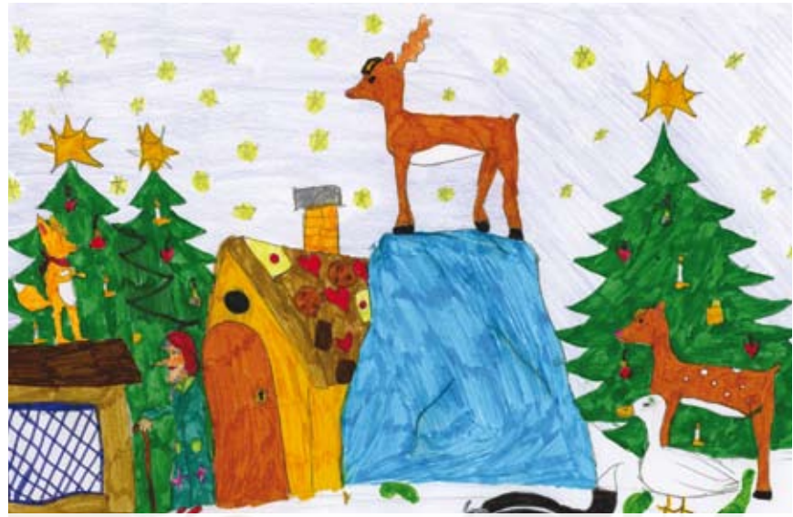
Előző Gyermekszemmel pályázatunk témája: Erdi karácsony az ÁRKÁD-ban. A nyertes: Sétáló Dominika. Nyereménye egy 5 000 Ft értékű ÁRKÁD vásárlási utalvány.