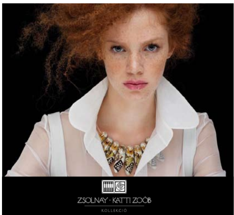
ZSOLNAY · KATTI ZOÓB KOLLEKCIÓ

Látogatóink jól tudják, mit jelent a márka, az érték – és időtállóság, s nem csupán ruházatukat illetően törekszenek igényességre. Ezért is szorgalmazunk minden olyan kulturális programot, melynek szellemisége jól tükrözi, kitűnően közvetíti Önök felé az ÁRKÁD bevásárlóközpont által fontosnak tartott értékeket is. Így kapott helyet nálunk ismét a Zsolnay-kiállítás, amely azonban most merőben más, mint amit legutóbb láthattak.