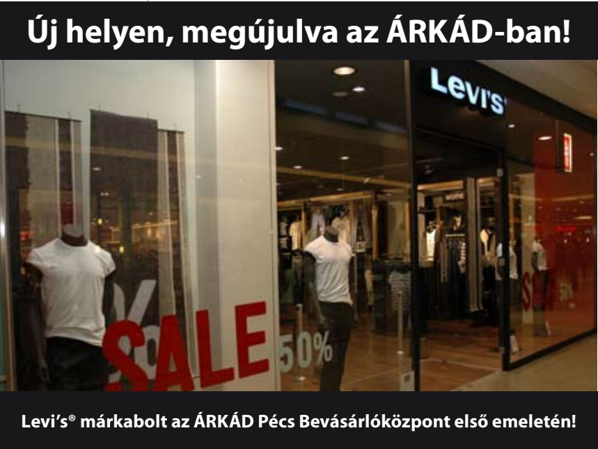
Levi's® márkabolt az ÁRKÁD Pécs Bevásárlóközpont első emeletén!