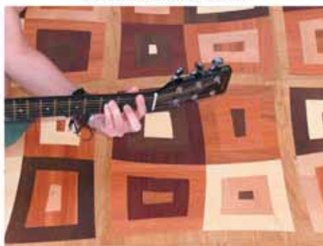
Modern mintát szeretne?