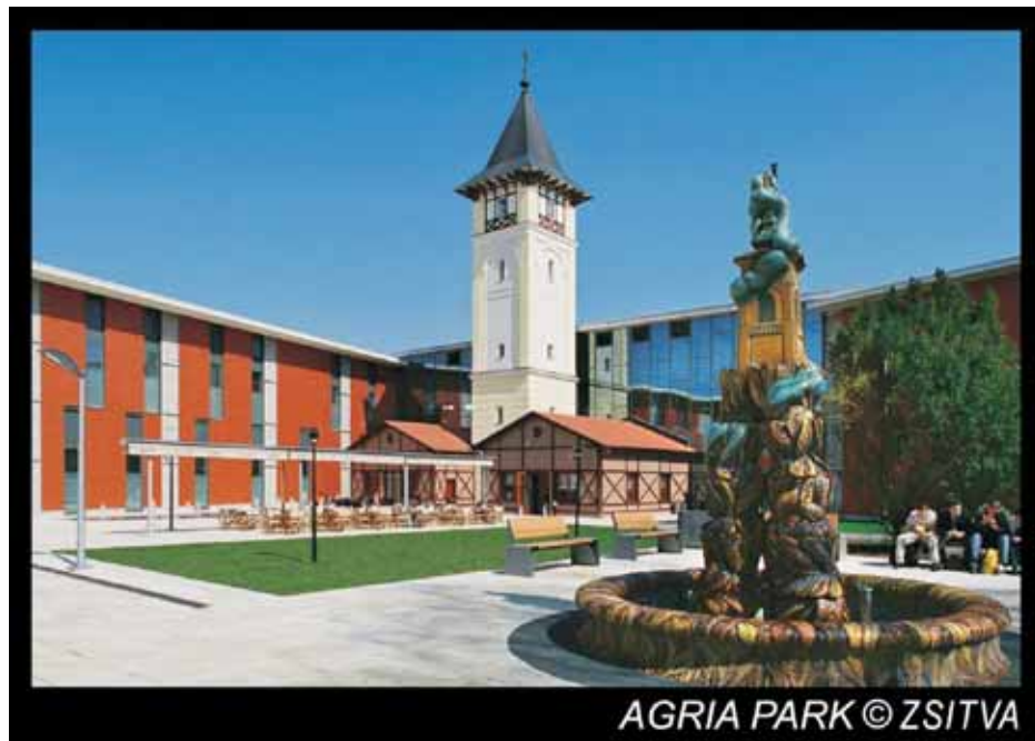
AGRIA PARK