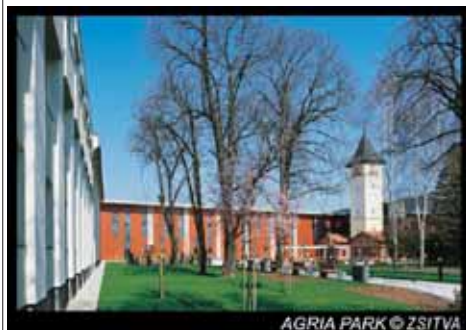
AGRIA PARK