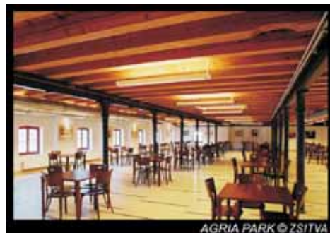
AGRIA PARK