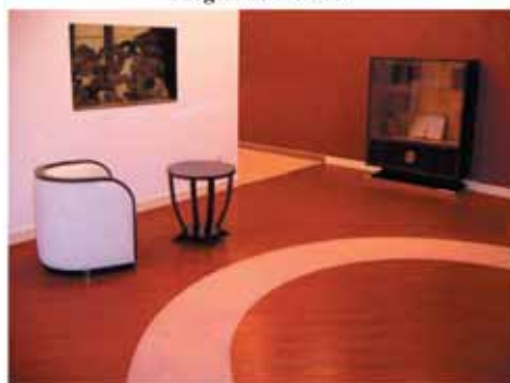
Megtörné a teret?