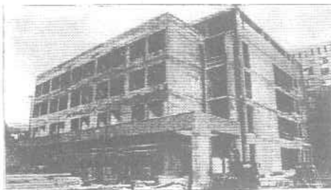
Az épülő szívcentrum