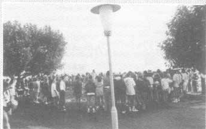
Hej, az a Badacsony...