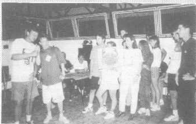
Hát fiúk, majdnem tőkéletes...