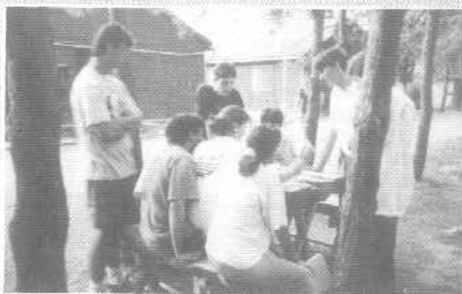
Készül a terv