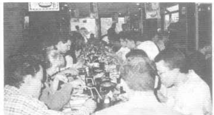
Közös kaja a helyi specialitásokat kínáló Pizza Hut-ban