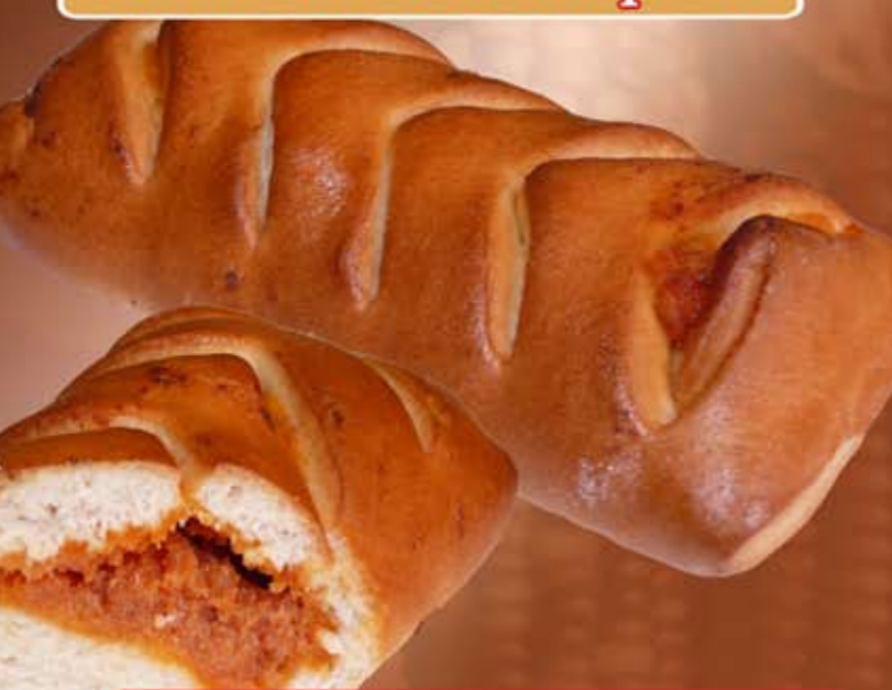
Kelt kolbászos párna