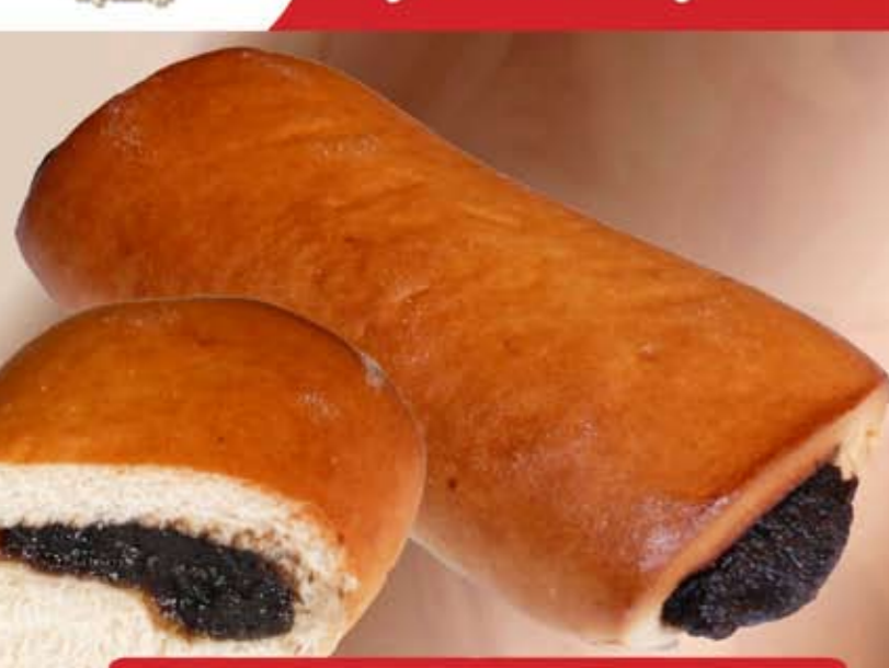
Kelt szilvalekváros párna