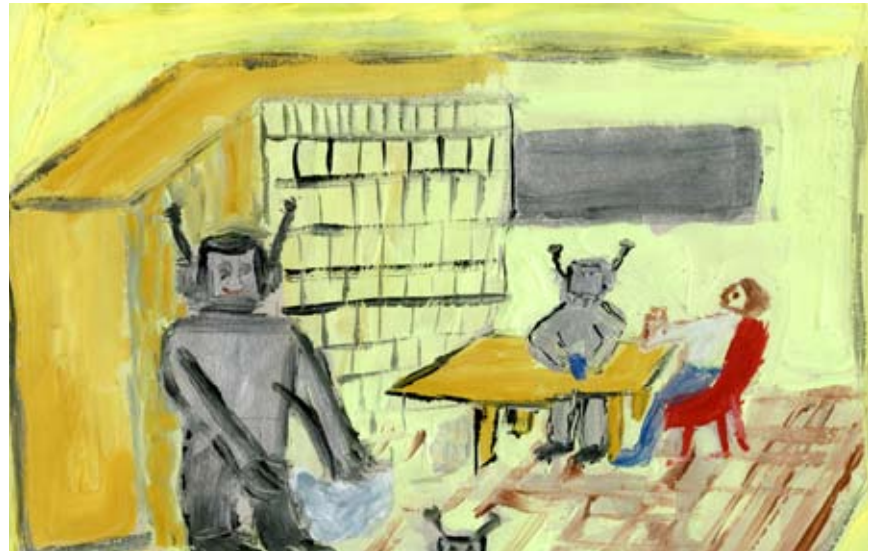
Előző Gyermekszemmel pályázatunk témája: A robotok évszázada. A nyertes: Hegedűs András. Nyereménye egy 5 000 Ft értékű ÁRKÁD vásárlási utalvány