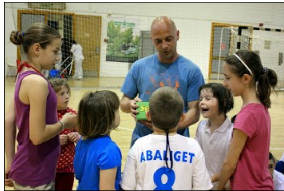
Egyházmegyei sportnap – Komló