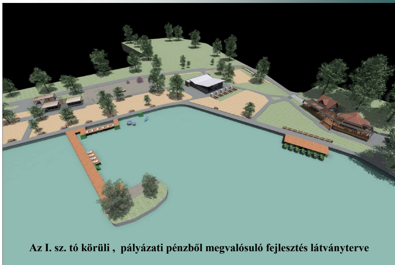
Az I. sz. tó körüli , pályázati pénzből megvalósuló fejlesztés látványterve