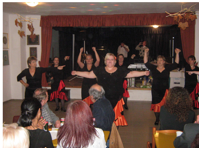
A szülők lehenyerlő táncos műsora