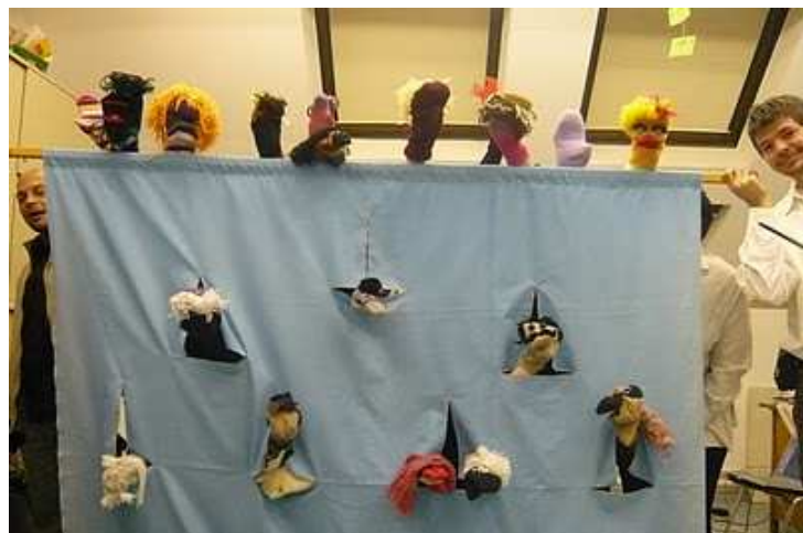
A tanárok zoknibáb műsora

Az idei 385 110,- Ft (ebből a büfé 136 980,- Ft) bevételből jut pénz jó minőségű bel- és kültéri ping-pong asztalokra, képesség és készség fejlesztő játékokra.