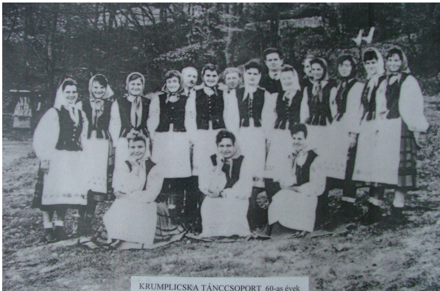
KRUMPLICSKA TÁNCSCSOPORT 60-as évek