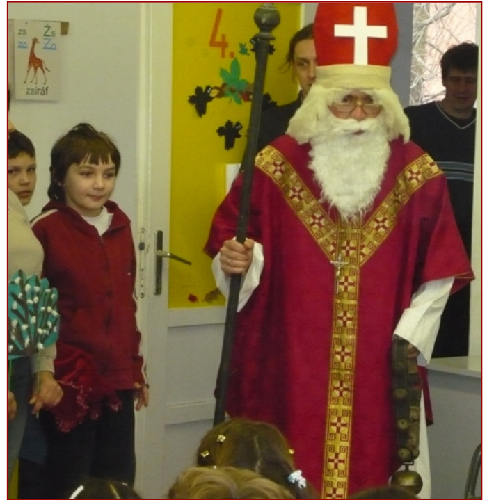
Mikulás az iskolában

A vegyesbolt a kifüggesztett rend szerint tart nyitva