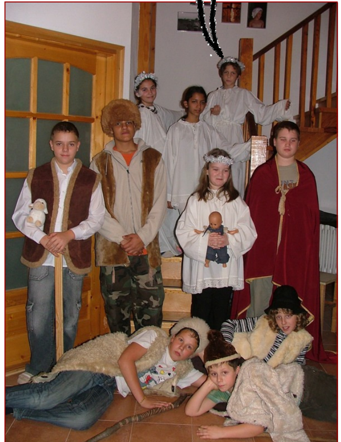
betlehemesek járnak a falu utcáit