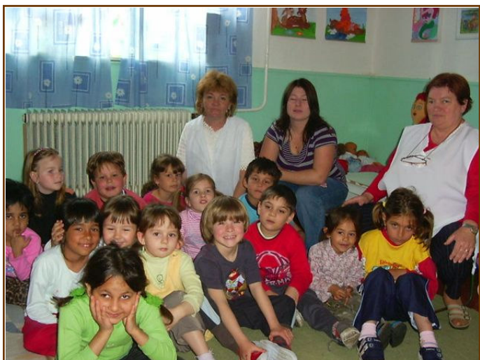
Ők a Mosolyovisok